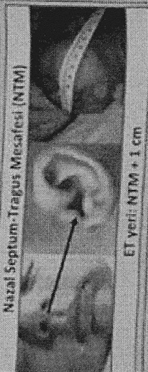
ET yeri: NTM + 1 cm